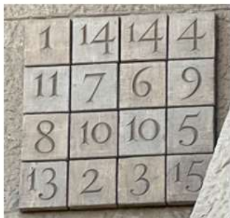
相同顏色的 4 個數字相加總和都是 33