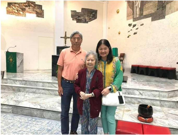
攝於 2019 年十月，聖三堂主日彌撒後。

因着媛宜姊妹的缘故，在她来达拉斯探亲时有幸结识，之后多有往来；更因为我妈妈的关系，两位老人家年龄相近，信仰相同，交往更形密切；但让我真正看到沈妈妈内心充满的爱德及对晚辈的照顾，是从一次返台之旅开始。