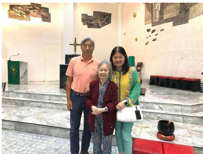
攝於 2019 年十月，聖三堂主日彌撒後。

因著媛宜姊妹的緣故，在她來達拉斯探親時有幸結識，之後多有往來；更因為我媽媽的關係，兩位老人家年齡相近，信仰相同，交往更形密切；但讓我真正看到沈媽媽內心充滿的愛德及對晚輩的照顧，是從一次返台之旅開始。